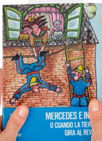
Mercedes e Inés o cuando la tierra gira al revés Noguer, 1981

Los valores de la amistad y de las relaciones familiares eran tratados, bajo el peculiar prisma de su autora cercano al